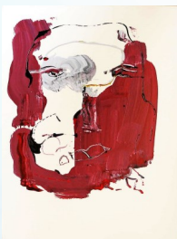
Smalti su cartone maschera

Nelle opere di Antonella Carraro il processo di creazione diventa un percorso catartico attraverso il quale l'artista entra in simbiosi con la tela. Non c'è consapevolezza del viaggio introspettivo che si è intrapreso, ma c'è un continuo avvicinarsi di cognizione ed emozione. La Carraro ha un rapporto quasi viscerale con il colore di cui utilizza solo quelli primari che mescola in un rituale meditativo fino a che è l'olio stesso a comunicare quando è pronto. È un rapporto simbiotico dove la cromia genera lo spazio lasciando respirare luce, forma, segno, immagine.