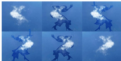
Polittico di una danza 3

Fotografa innovativa, concentra la sua attenzione artistica sul fenomeno della pareidolia delle nuvole, regalandoci immagini uniche e suggestive. L'abilità artistica e l'attenta osservazione fanno sì che la Ragazzi riesca a dar vita a forme ed oggetti semplicemente creando un contorno e/o giocando con luci ed ombre. Le sue fotografie ci trasmettono tutta la magia propria dell'arte: saper andare oltre la dimensione finita ed oggettiva per spaziare con la mente e il cuore in dimensioni infinite interpretabili secondo la soggettività di chi le osserva.