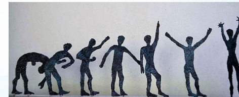
Dal gioco alla gioia

Quella di Vincenza Spiridione è una scultura figurativa di grande espressività, attenta al particolare e alla resa comunicativa di ogni dettaglio. I volti delle sue sculture si caricano di intensità umana, e quello che cattura e affascina l'osservatore è l'emozione e il sentimento che trapela da quei visi e da quelle mani. È una scultura ricercata che va oltre la resa espressiva, armonica, estetica e che porta l'artista a mettersi sempre in discussione arrivando a trattare tematiche sociali attuali e scottanti in un processo di necessaria riflessione costruttiva.